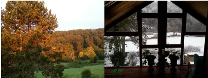
Blick aus der Praxis